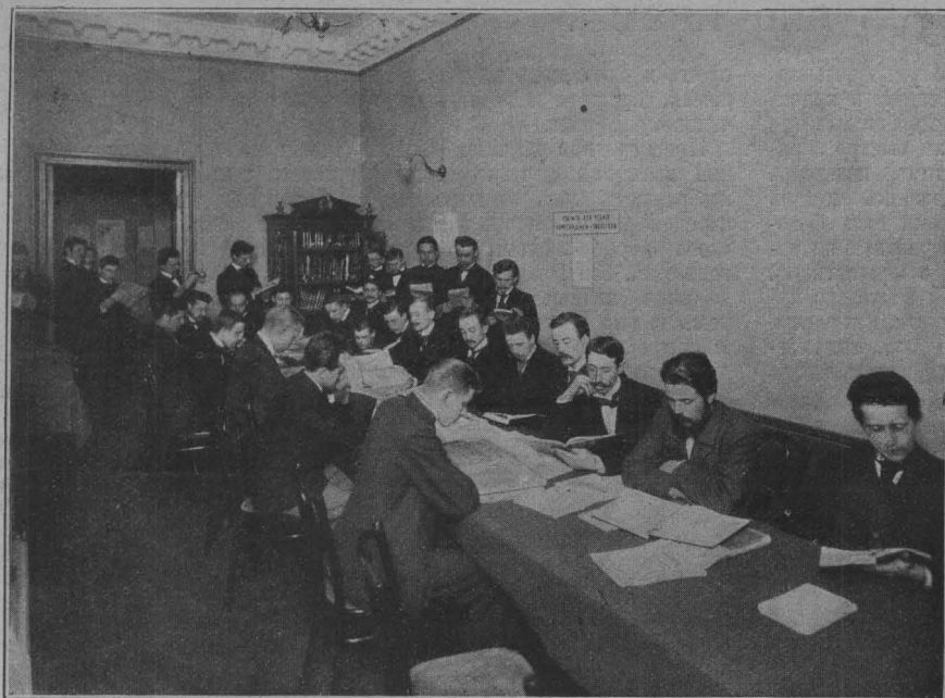
Комитетъ содѣйствія нравственному и физическому развитію молодежи въ Петербургѣ. Читальня.

ныя картины береговъ—такія картины, какихъ они и не видавали у себя на родинѣ. Тамъ плоскіе поля и луга тянутся безъ конца во всѣ четыре стороны, а здѣсь встаютъ дикія отвѣсныя скалы, исчерченные трещинами и разрисованныя фестонами мха и узорами обнаженныхъ горныхъ породъ. И пусто, безлюдно на этихъ дикихъ скалистыхъ берегахъ, пусто и въ долинахъ, заросшихъ лѣсами. Ждетъ земля людей—владѣльцевъ—и вотъ, они ѣдутъ къ ней,—ея будущіе хозяева и работники.