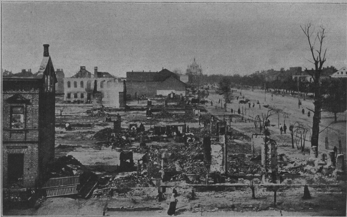
Пожаръ въ Брестъ-Литовскѣ. Общій видъ одного изъ кварталовъ послѣ пожара.

Огонь, продолжавшійся два дня, такъ быстро переходилъ съ одного квартала на другой, что жителямъ сгорѣвшихъ кварталовъ и владельцамъ лавокъ не было никакой возможности спасти свое имущество; выброшенные на улицу вещи тутъ же сгорѣли. Такимъ образомъ, около 20,000 человекъ осталось безъ крова, а большинство изъ нихъ — и безъ всякихъ средствъ къ существованію. Убытки отъ пожара исчисляются въ громадную цифру — до 7,000,000 рублей. Нужно имѣть въ виду, что эта огромная цифра убытковъ составила изъ сотенъ, чуть ли не десятковъ рублей,