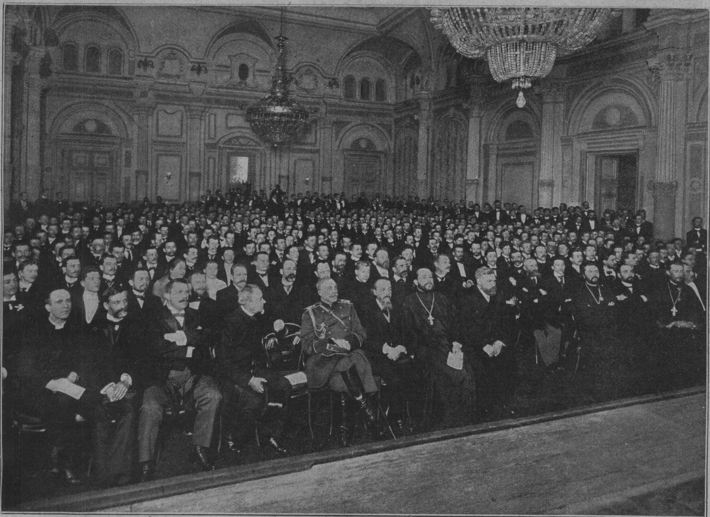
Первый литературно-художественный вечеръ, устроенный въ кредитномъ обществѣ комитетомъ для содѣйствія нравственному и физическому развитію молодежи.

Превосходная картина И. А. Асканзія, находившаяся на послѣдней выставкѣ картинъ с.-петербургскаго общества художниковъ, изображаетъ тотъ моментъ, когда Соломонъ, диктуя писцу свои изреченія, восклицаетъ знаменитыя, увѣковѣченныя Св. Писаніемъ, слова о суетѣ суетъ. Роскошь и изящество его обстановки превосходятъ все возможное для того времени и, въ изображеніи художника, являются ослѣпительными. Соломонъ сидитъ на мраморномъ тронѣ; у его ногъ, олицетворяя собою сфинксовъ, лежатъ рабы. И среди всего этого блеска и величія — какимъ глубокимъ выраженіемъ скорби полно старчески прекрасное лицо царя! Стоитъ вгля-