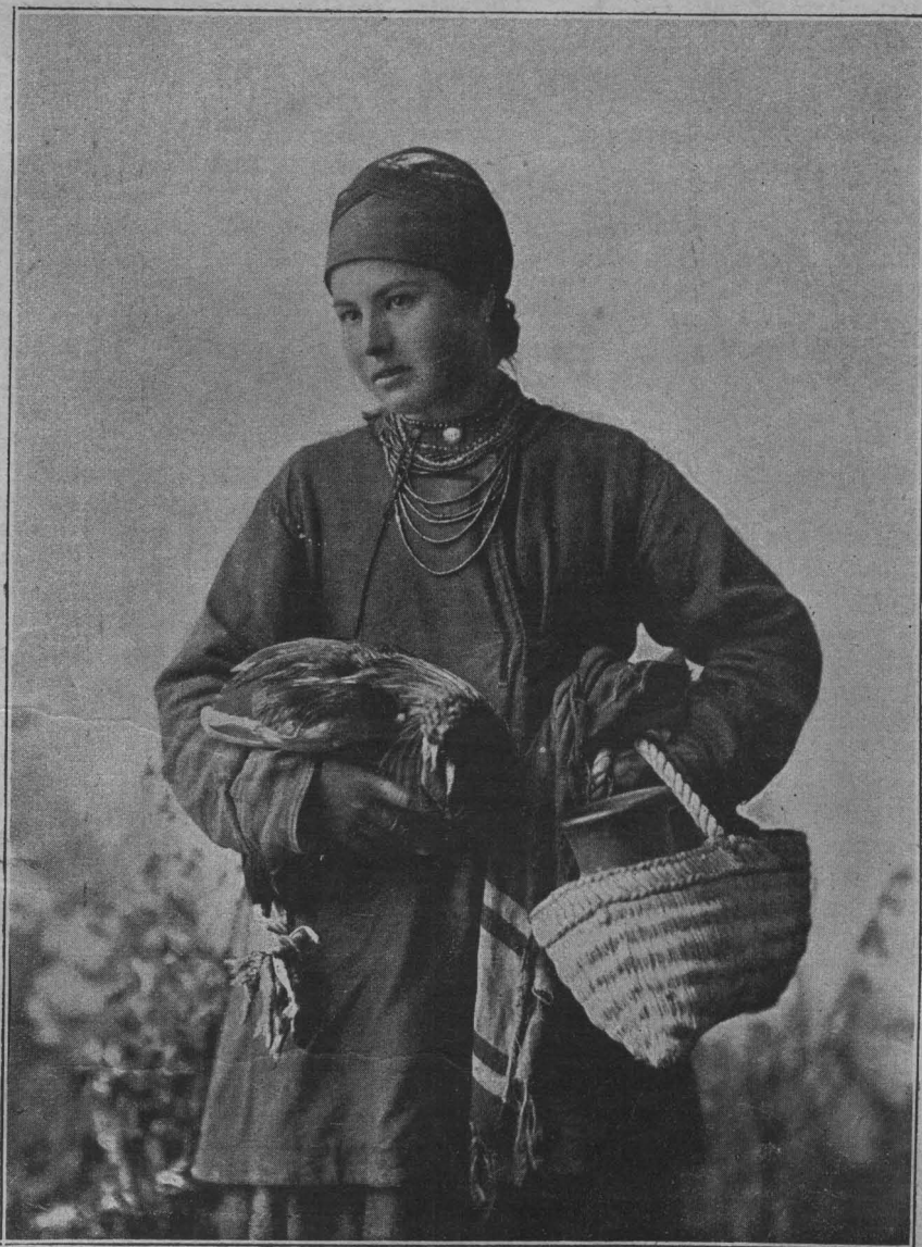
Казачка. Фотоэтюды Л. Завадскаго. Авт. «Нивы».

И страшно для Михаила звучали эти слова, которыя Аркадій Михайловичъ произносилъ, повидимому, очень спокойнымъ и простымъ тономъ: