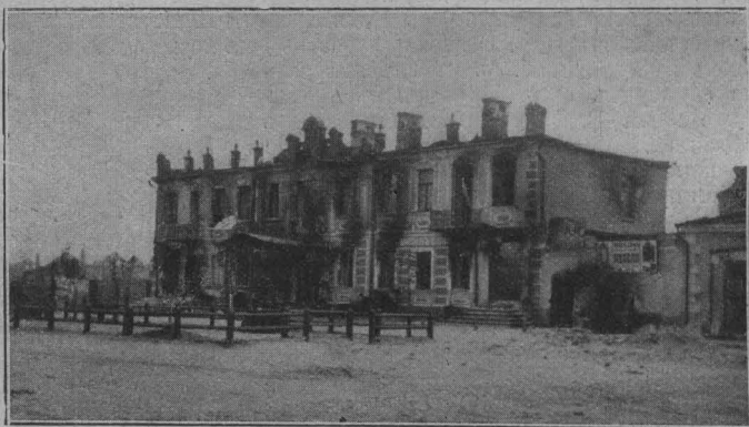
Пожаръ въ Брестъ-Литовскѣ. Гостиница «Европа» послѣ пожара.

дицинскаго института», «общества улучшенія быта питомцевъ воспитательнаго дома», «русскаго женскаго взаимно-благотворительнаго общества», «общества пособія слушательницамъ педагогическихъ курсовъ и слѣб. медицинскаго института» и т. д.