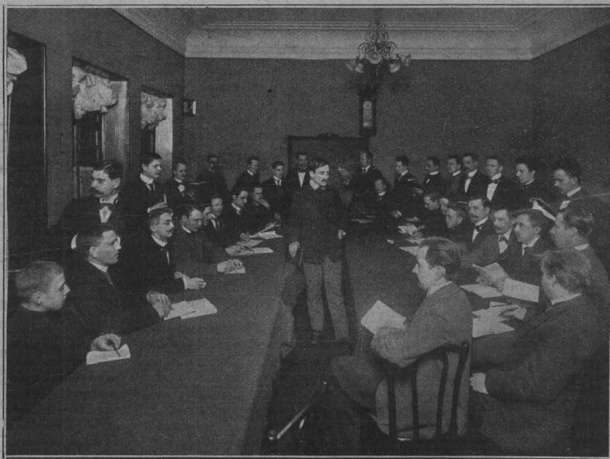
Комитетъ содѣйствія нравственному и физическому развитію молодежи въ Петербургѣ. Урокъ французскаго языка.

Въ заключеніе слѣдуетъ пожелать этому симпатичному и полезному учрежденію полного преуспѣванія. И цѣли, и осуществленіе задачъ «комитета»—нравственное совершенствованіе молодежи заслуживаютъ всеобщаго сочувствія. Одинокая, безсемейная молодежь крупныхъ городскихъ центровъ, лишенная нравственной поддержки, поддается вреднымъ вліяніямъ. Зажженные повсюду «Маяки» могли-бы тысячи молодыхъ людей во время удержатъ отъ многихъ ошибокъ и иногда даже отъ гибели.