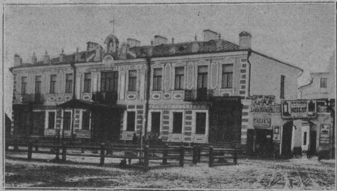
Пожаръ въ Брестъ-Литовскѣ. Гостиница «Европа» до пожара.

Всего пострадало 494 домохозяина и около 20,000 жильцовъ.